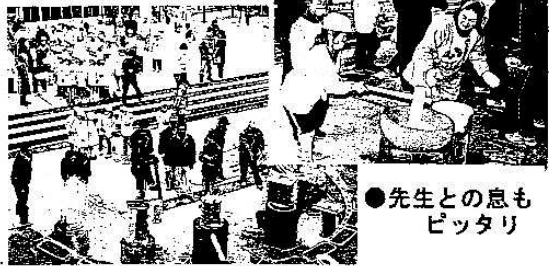
●先生との息もピッタリ